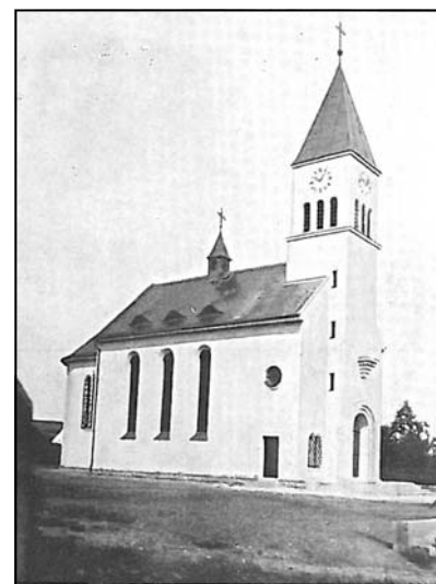
KOSTEL SV. CYRILA A METODĚJE V ZÁVIŠICÍCH

Přesto však museli Závišané čekat na nový kostel do r.1935 a na nový hřbitov do r.1934. Doba od vzniku Jednoty pro postavení kaple v Závišicích v r.1898, přes řadu jednání od r. 1911 a přerušených 1.světovou válkou, až do r.1935, představuje však druhou etapu usilování o vlastní kostel, tentokrát však korunovanou úspěchem. V těchto souvislostech je třeba se zmínit i o tom, že už v r.1861 byla postavena v Pasekách kaplička zasvěcená sv. Panně Marii, jak to dokazuje prohlášení majitele příslušného pozemku datované 19.září 1861 a podepsané dvěma svědky.